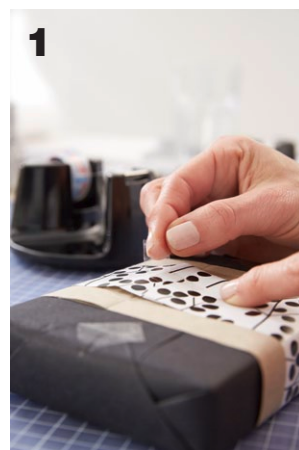
1 Die Geschenke einpacken. Papier mit tesa-film® fixieren.