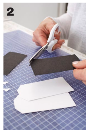
2 Aus weißem und schwarzem Karton 5,5 x 11 cm große Rechtecke zuschneiden. An einer schmalen Seite die Ecken abschneiden.