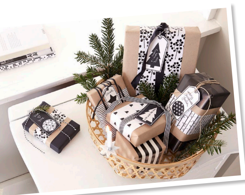
Vorlage auf Seite 2