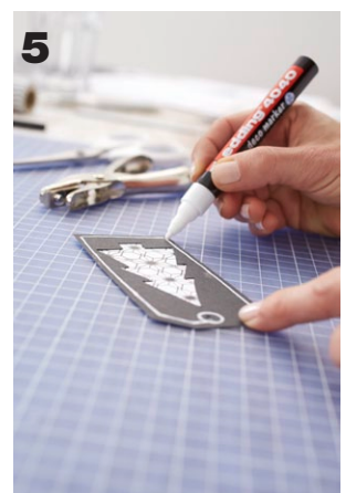
5 Mit dem wasserfesten Filzstift einen Rahmen um den Anhänger zeichnen und beschriften. Wenn alles gut getrocknet ist, den Anhänger mit einem Band am Geschenk befestigen.