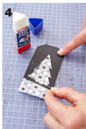
4 Äußere Anhängerform auf das gemusterte Papier übertragen und ausschneiden. Klebstoff auftragen. Beide Teile (Anhänger in der Mitte oben lochen) zusammenkleben.