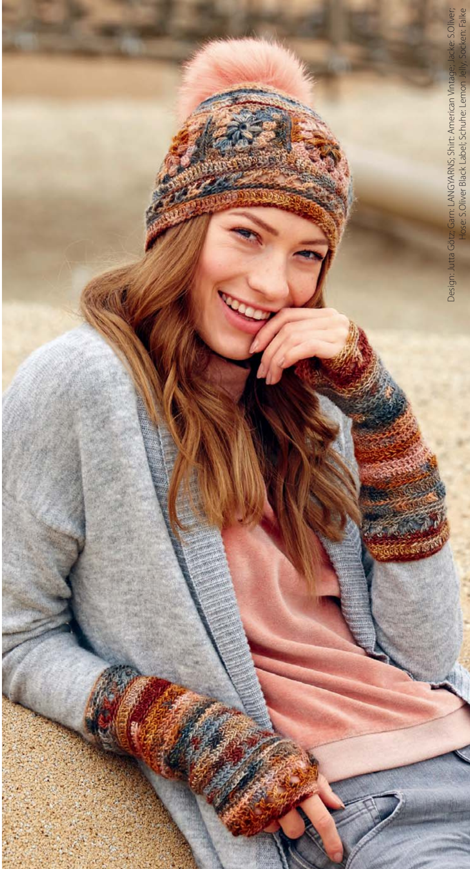
Design: Jutta Götz; Garn: LANGYARNS; Shirt: American Vintage; Jacke: S.Oliver; Hose: S.Oliver/Black Label; Schuhe: Lemon Jelly; Socken: Falke