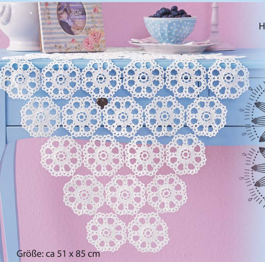
Größe: ca 51 x 85 cm