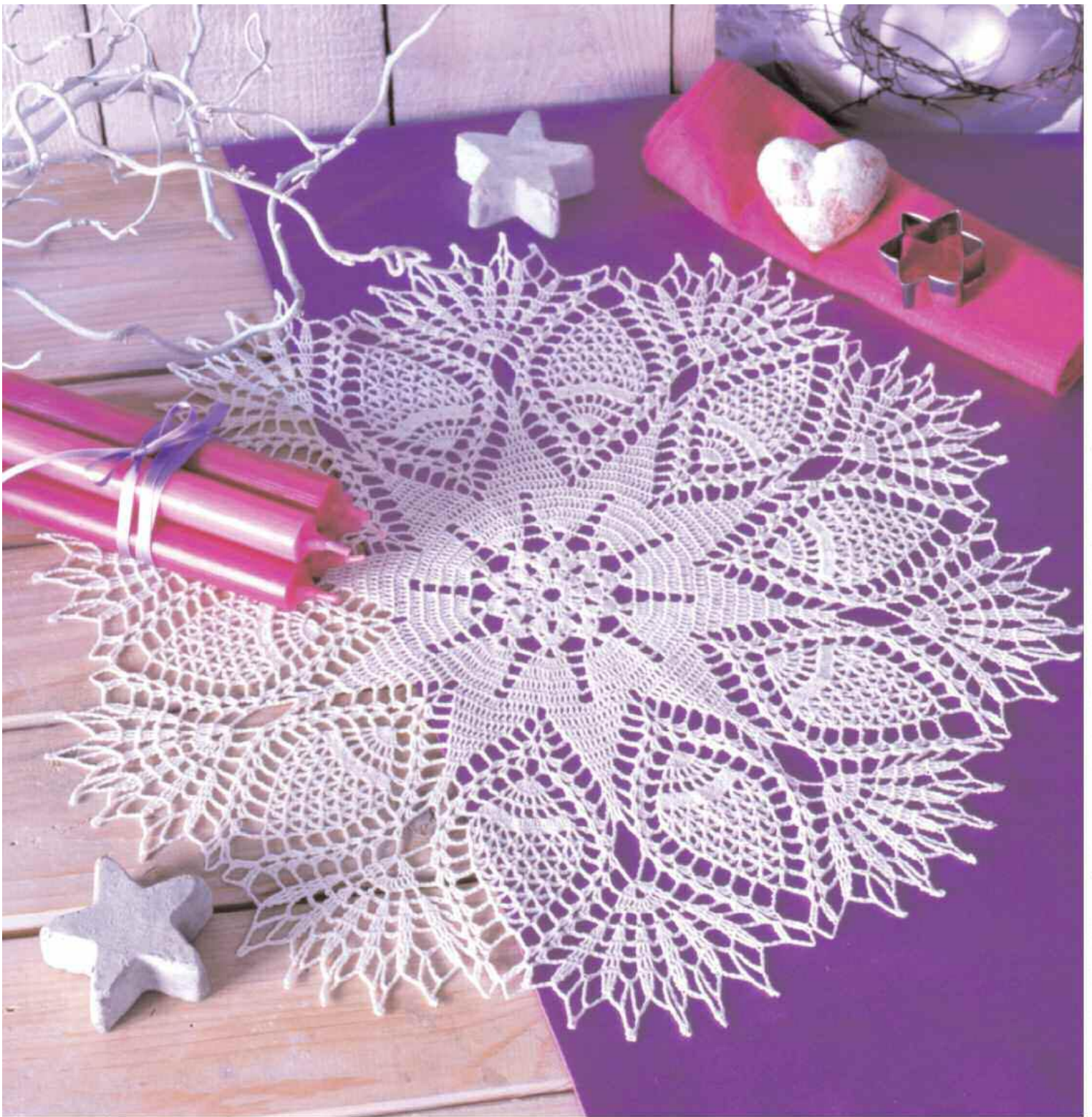
Idee + Realisation: Wiltrud Wagner-Stadtler, Fotografie: Uzwei Fotodesign Uwe Bick, Styling: Karin Schlag